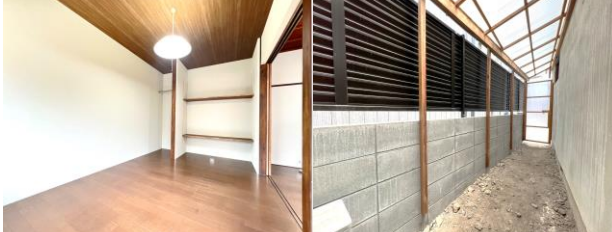
【屋根付駐輪場 兼 物置】