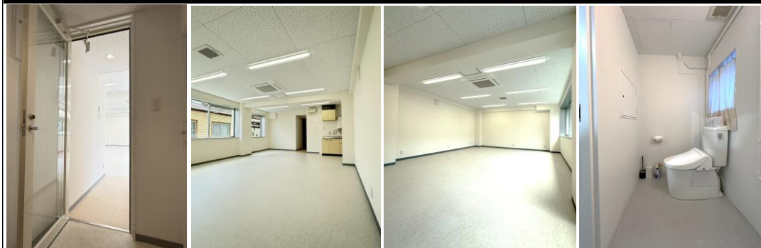
◆◆完成写真◆◆ (撮影年月:2026.5)